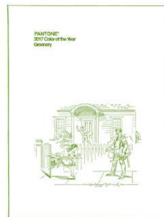
Immagine digitale per la stampa